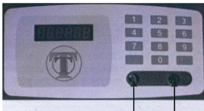
kulcslyuk a vésznyitó kulcshoz