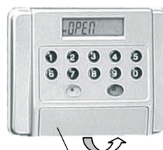
kulcslyukat takaró fedél

A széfet ne telepítse nedves környezetbe (pl. fürdőszobába, borospincébe), mert az elektronikát súlyos károsodás érheti. Az ebből eredő meghibásodásért felelősséget nem vállalunk. Ilyen esetben a garancia is érvényét veszti!