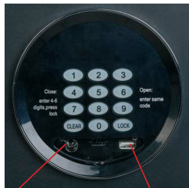
Kulcslyuk a vésznyitó kulcshoz