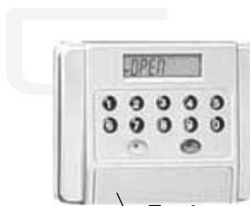
kulcslyukat takaró fedél

A széfet ne telepítse nedves környezetbe (pl. fürdőszobába, borospincébe), mert az elektronikát súlyos károsodás érheti. Az ebből eredő meghibásodásért felelősséget nem vállalunk. Ilyen esetben a garancia is érvényét veszti!